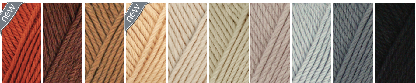
2239 Brick 385 Coffee (250) 2218 Hazelnut 2208 Sand 2212 Linen (2216) 2213 Bone (10) 340 Taupe 2232 Light Grey 2235 Ash 325 Black (9999)