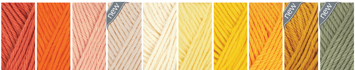
2198 Dusty Orange (253) 2194 Orange (3104) 211 Peach (262) 2192 Pale Pink 2172 Cream (39) 274 Light Yellow 2180 Bright Yellow (279) 2178 Sunflower (273) 2211 Curry 402 Seagrass