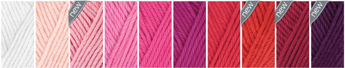
310 White (202) 203 Light Pink (12) 227 Antique Pink 239 Fresa 241 Magenta 248 Cerise 316 Red (16) 318 Tomato 222 Bordeaux 251 Aubergine