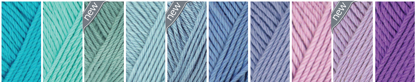
371 Turquoise (201) 337 Light Aqua (2121) 2134 Vintage Green 2124 Baby Blue (13) 289 Blue Grey 290 Denim (14) 267 Blue Lilac (284) 396 Lavender (11) 268 Pastel Lilac 270 Purple (285)